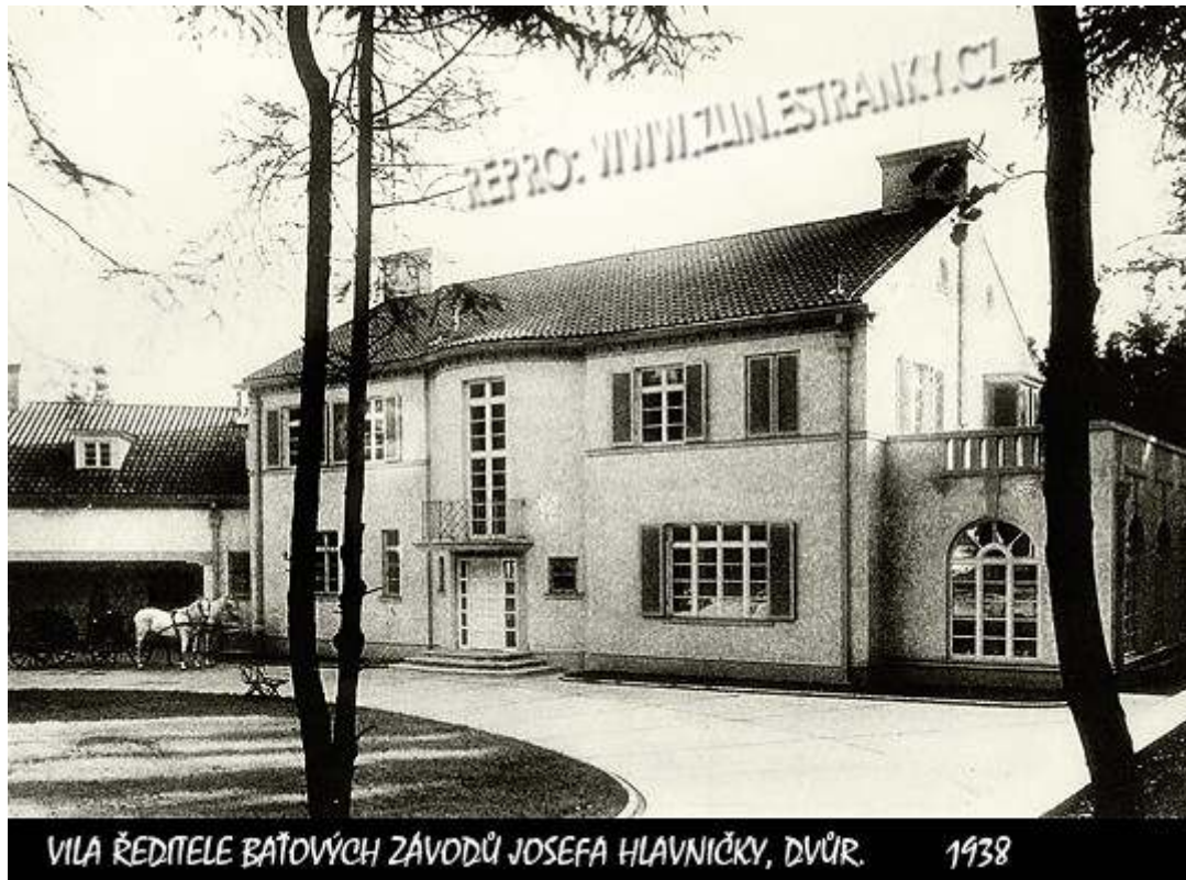
Hlavničkova vila od jihu

Šestačtyřicetiletý Hlavnička měl pohřeb 29. května 1943. Rozloučit se s ním, prakticky manifestačně, přišly desítky tisíc občanů. Po dlouhé době od začátku okupace byla zlínská obec spolupracovníků opět propojena jediným jménem – loučila se s druhem Jana Antonína – a před ním i Tomáše – Bati. Předposlední baťovská akce ve Zlíně, i když rámovaná černými prapory. Další už „zdobily“ zástavy úplně jiných barev.